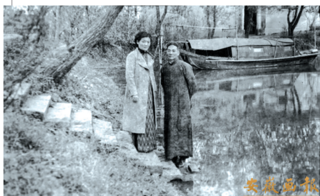
童汉章烈士生前最后一张照片（与亲妹妹合影留念）