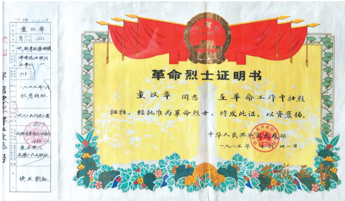
童汉章的革命烈士证明书