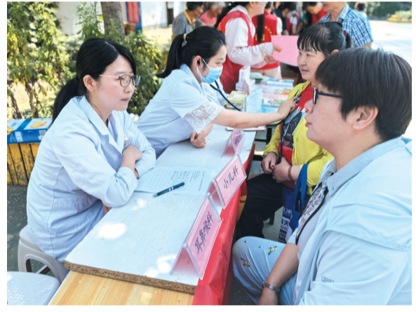
6月10日,合肥市瑶海区铜陵路街道社区卫生服务中心联动合肥市二院组织一支多学科医护团队走进五里井社区,开展公益义诊暨健康科普讲座一体化便民服务活动。本次活动采用“健康科普+现场义诊”的模式,精准贴合服务全年龄段居民健康生活需求。 吴兰保 高元元

下一步,颍河镇葛大店社区妇联将以此家风家教宣讲为契机,持续聚焦“三新”领域商圈女性群体需求,让科学家庭教育理念走进商圈妇联,夯实家庭幸福基础,让商圈“三新”领域妇女群众都感受到妇联组织的温暖与力量,筑牢妇女权益保障防线,为推进基层治理法治化注入“她力量”,促进家庭幸福与社会和谐。