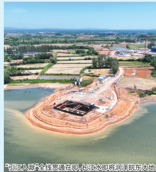
“引江入滁”全线贯通在即，长江水即将润泽皖东大地