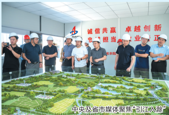
中央及省市媒体聚焦“引江入滁”

2026年盛夏，一条全长97.4公里的“输水大动脉”即将在皖东大地贯通。总投资18.1亿元的“引江入滁”供水保障工程，多年谋划、日夜攻坚，正从蓝图变为现实。作为滁州市2026年十大民生实事之首的“一号工程”，将从根本上改写滁州“靠天吃水”的历史，为150万群众引来一泓奔流不息的长江清水。 包增光 记者 胡昊