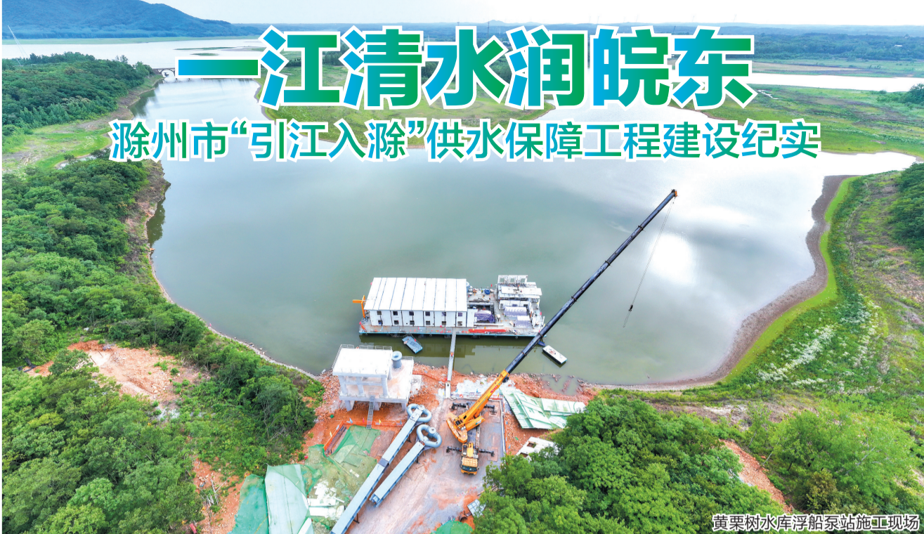
黄栗水库浮船泵站施工现场