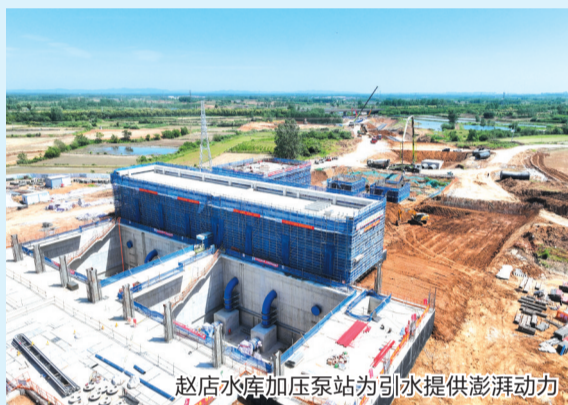
赵店水库加压泵站为引水提供澎湃动力

项目的实施，标志着滁州供水体系实现从“被动蓄水”向“江库联调”的历史性转变，从“保障生存”向“支撑发展”的战略升级，更成为滁州融入长三角一体化发展的重要基础设施支撑。