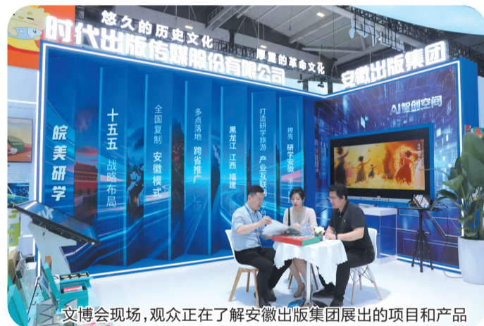
文博会现场，观众正在了解安徽出版集团展出的项目和产品

凭借成熟可复制的运营模式，“皖美研学”已成功走出安徽。2025年，平台全套解决方案输出至黑龙江出版集团，与江西报业集团签订战略合作协议，目前正与福建省等多个省份推进合作，标志着“皖美研学”模式已具备全国复制推广的价值与能力。“十五五”期间，平台将全力打造研学旅游产业互联网平台，持续擦亮“研学安徽”金字招牌。