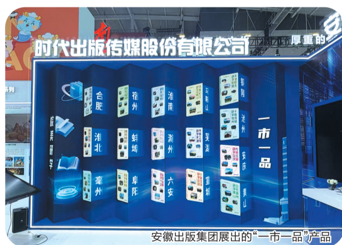
安徽出版集团展出的“一市一品”产品