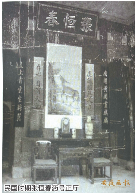
民国时期张恒春药号正厅