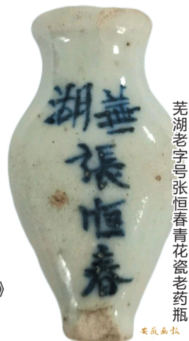
芜湖老字号张恒春青花瓷老药瓶