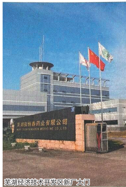
芜湖经济技术开发区新厂大门