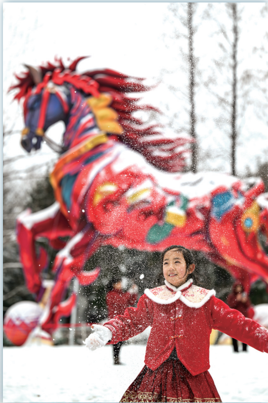
合肥逍遥津公园银装素裹,成为市民游客寻雪、赏雪的绝佳去处

气象专家建议,关注降雪叠加持续低温冰冻和前期积雪导致的道路湿滑,对交通出行有不利影响,请加强交通安全管理;防范积雪对设施农业、简易搭建物和体育馆等大跨度建筑的影响。沿江江南仍有大风天气,防范高空坠物、户外临时构筑物、水上交通以及农业蔬菜大棚等的安全风险。关注强降温对人体健康、农业生产和能源供应的不利影响。