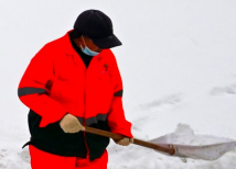
合肥政务区,工作人员在清理积雪