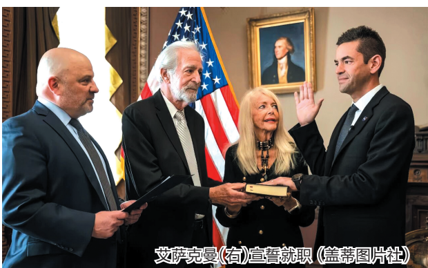
艾萨克曼(右)宣誓就职

此次上任NASA局长,艾萨克曼肩负着一个艰巨的任务:带领美国人重返月球。 近期,特朗普明确表态,希望美国打造一个永久性月球基地,以此开采资源,并作为前往火星的中转站。他要求美国人在2028年前重返月球,并在2030年前建立永久月球前哨站的初始设施。特朗普在声明中称,该命令为“美国优先”的太空政策制定了愿景,以确保美国在太空探索、安全和商业领域“引领世界”。 艾萨克曼就职后不久,便给NASA员工发了一封信,重申了在月球建立基地和登陆火星的计划。 他在信中写道:“我们必须集中所有人才和资源,去完成一个近乎不可能的任务。”此外,艾萨克曼还重申了“月球采矿计划”。路透社分析认为,艾萨克曼的发言是一种暗示,即“将中国视为竞争对手”。然而,目前的NASA正饱受人才流失的困扰。有知情人士透露,人员流失严重削弱了NASA的专业人才储备,“如今的人才梯队已不复往日规模”。 人才少了,支出却不少。国际知名月球科学家