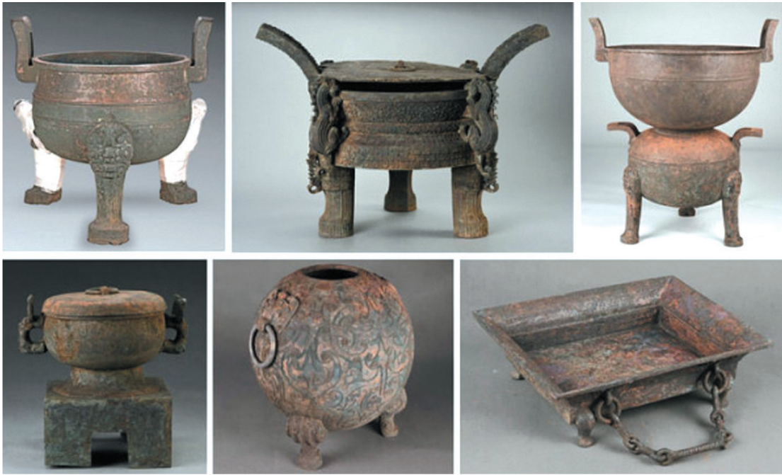
武王墩一号墓出土的铜器(资料照片)

武王墩一号墓出土的文字遗存堪称“先秦文献宝库”，涵盖梓木墨书、青铜器铭文、枕木刻章等多种形式，为破解楚国历史密码提供了关键线索。在梓室盖板及梓墙上提取的100多句、1500余字墨书文字，是典型的楚国文字，内容多标注木材位置，如“北乐府割十四”明确指示这是“乐府”区域的第十四块盖板，而对应墓室恰好出土各类乐器，印证了文字与功能区的精准对应。这些墨书是目前国内发现数量最多、等级最高、内容最丰富的先秦墨书文献，成为研究楚国职官制度与陵墓营造流程的“活字典”。更具价值的是文字中蕴含的多元文化印记——除楚国墨书外，还发现了三晋乃至秦国文字，直观反映了战国晚期区域文化的频繁交流。枕木上发现的四枚“王之阳瑟”刻章铭文，则揭示了王墓营建的专属等级。而青铜器上“楚王禽前”四字铭文，更是直接锁定墓主人为楚考烈王熊完，为还原战国晚期楚国东迁后的历史脉络提供了核心锚点。