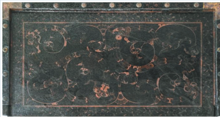
武王墩一号墓出土的漆案