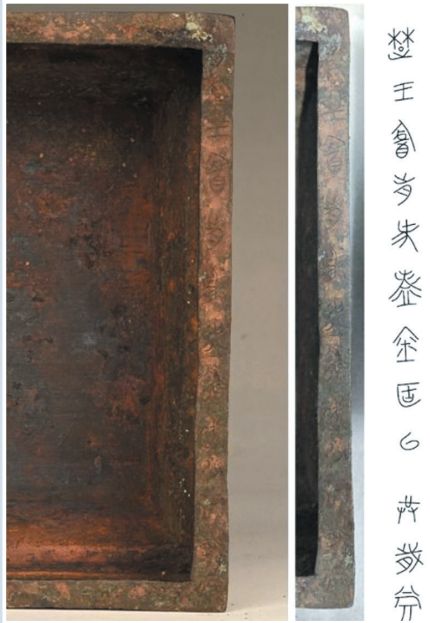
武王墩一号墓出土的铜簠铭文