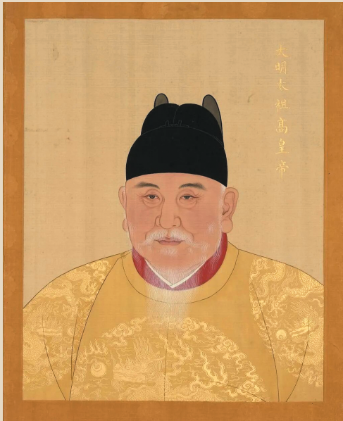
台北故宫博物院“穿越看洪武”中展出明太祖老年时的画像,为紫禁城南薰殿旧藏《明代帝后半身像》册中的第一开