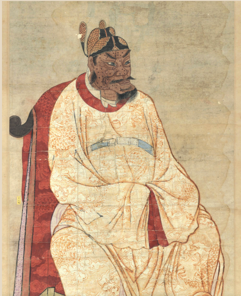
台北故宫博物院藏明太祖半身像 佚名 明代

据文献记载,明太祖的异相,起源于永乐帝朱棣为巩固政权而进行的吹捧和神话,成为流行于民间的主流,而明太祖真正的样貌被称为正形像,则成为皇宫中缅怀明太祖用的隐藏正版,现多收藏于故宫与国家博物馆等机构。此次教科书上更换明太祖肖像,以正形像换异形像,或更符合历史的史实。从多位学者撰写的专业文章来看,朱元璋奇骨异貌的长相之所以会在民间广为流传,是在当时的政治宣传与民间心理的双重作用下形成的。