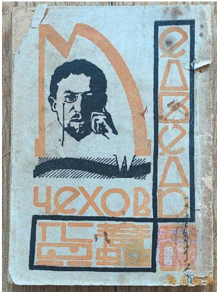
王青士为《蠹货》设计的封面