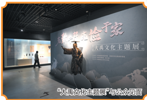
“大禹文化主题展”与公众见面