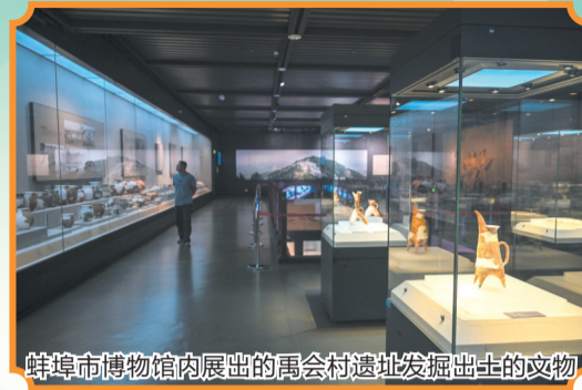
蚌埠市博物馆内展出的禹会村遗址发掘出土的文物