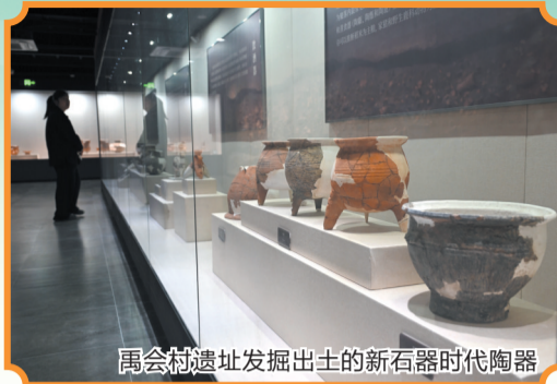
禹会村遗址发掘出土的新石器时代陶器

大禹文化是淮河文化的核心，在中华文明的形成过程中占有重要的地位。4月25日上午，2025年蚌埠市首届大禹文化节暨第四届社会各界祭祀大禹典礼活动盛大启幕，通过文化交流、经贸洽谈等18项活动，向世人展示流淌在蚌埠人血脉中的大禹精神与大禹共识，彰显中华优秀传统文化的永恒魅力与蓬勃生命力。文/吴承江