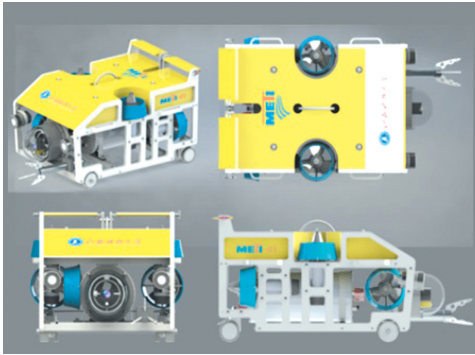
结构检测与作业型机器人