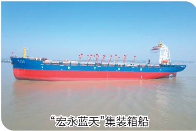
“宏永蓝天”集装箱船