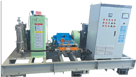
超高压水除锈机器人超高压泵组