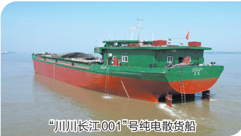
“川川长江001”号纯电散货船