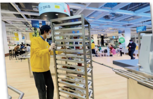
工作人员在准备午餐