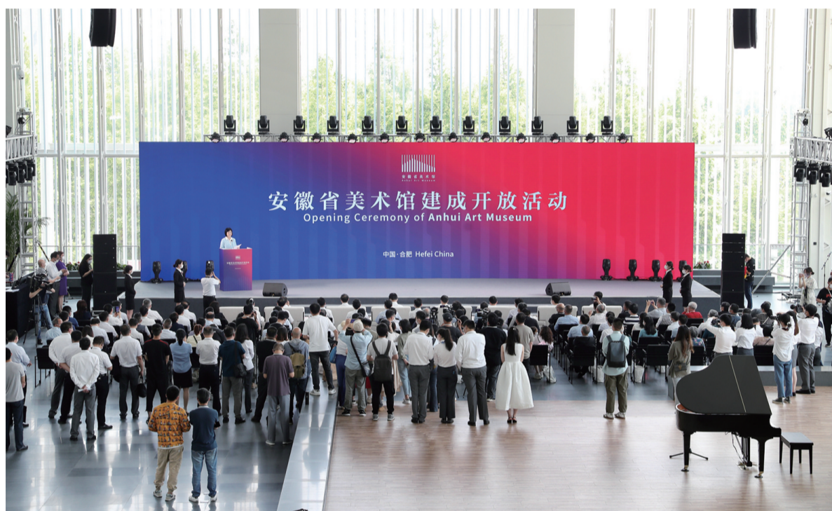
安徽省美术馆举行建成开放活动现场