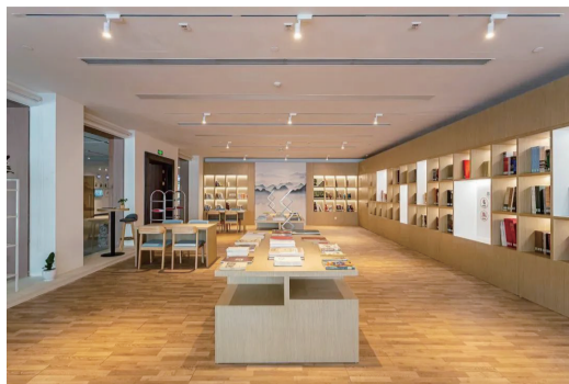
安徽省美术馆阅读空间