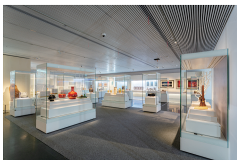
安徽当代工艺美术作品展