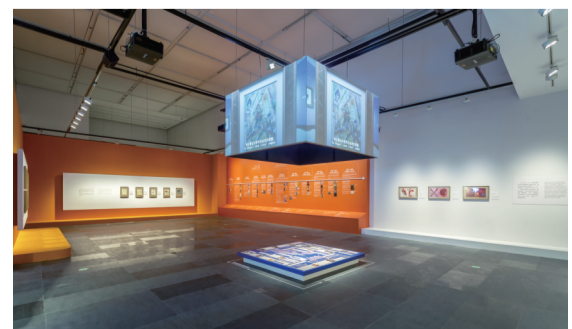
马克·夏加尔物色之梦 数字艺术展

需要提醒的是,市民前往安徽省美术馆参观需要提前预约。观众可凭有效身份证件,通过“安徽省美术馆”微信公众号或官网进行参观预约;也可通过支付宝APP搜索“安徽省美术馆”进入小程序进行预约。