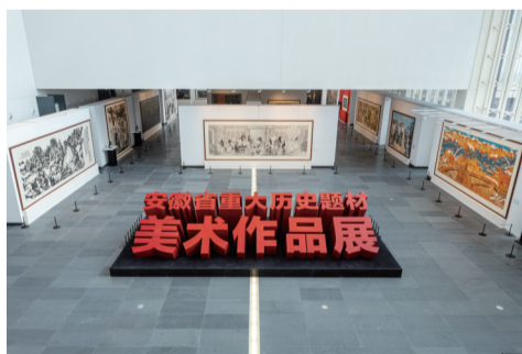
安徽省重大历史题材美术作品展