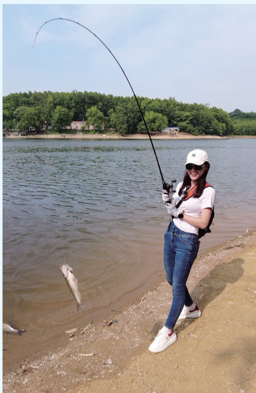
“哪了娜娜”日常钓鱼