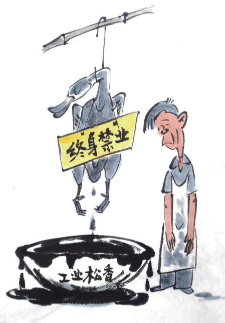
下场 ■ 王恒