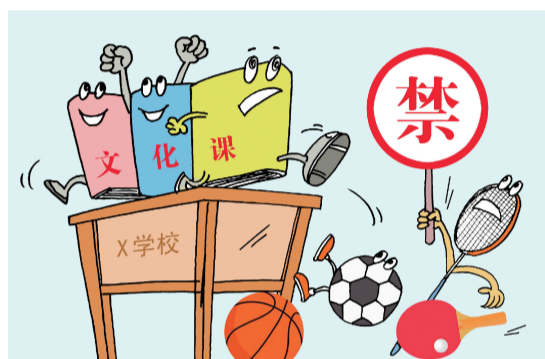
挤占 ■ 高晓建