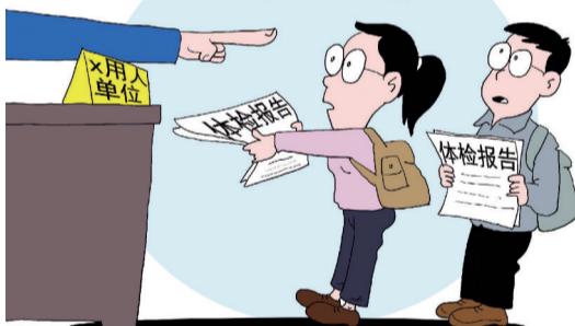
应聘 ■ 韦荣景