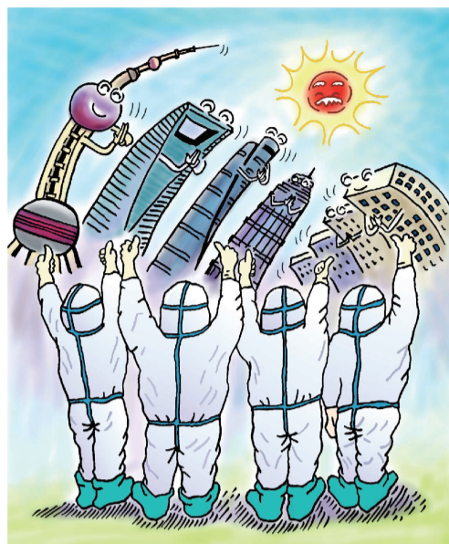
衷心谢谢您,大白! ■ 王真