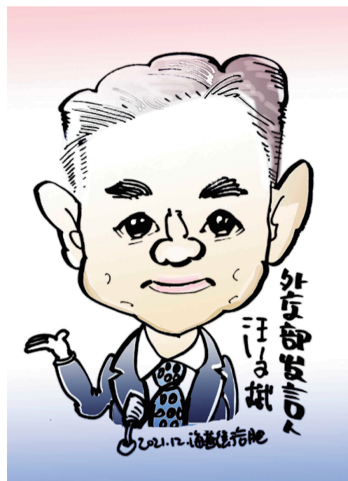
外交部发言人汪文斌 ■ 张海燕