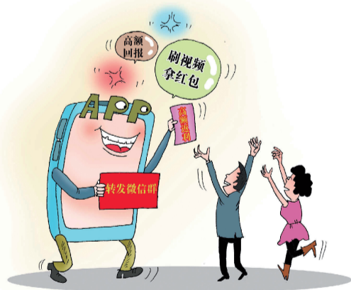
“拉人头”APP ■ 沈海涛