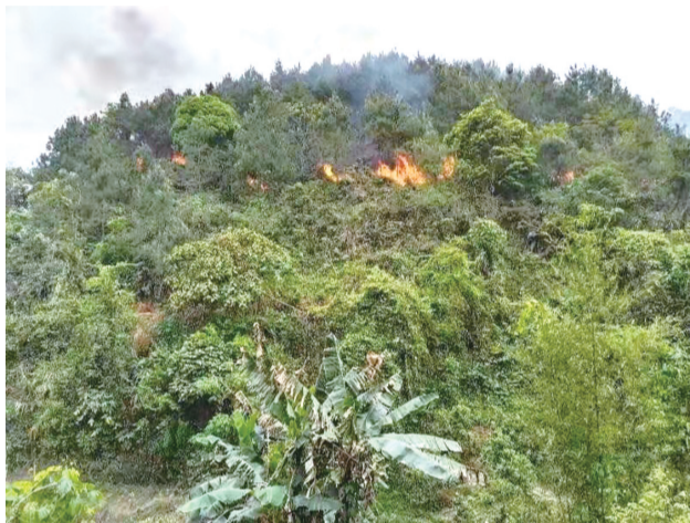
这是3月21日拍摄的藤县坠机事故现场周边画面(手机照片)。

此外,东航也已启动应急机制,派出工作组赶赴现场,并已开通应急援助电话:4008495530。东航派出的工作组当晚18时执飞MU799次航班飞赴广西梧州,同时成立了各个小组正在处理后续事宜。另据东航公告,本次飞机失事的原因还在调查中,公司将积极