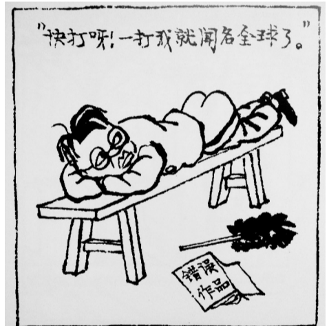
挨批的自觉性 ■ 华君武

华君武(1915~2010年),原名华潮,中国著名美术活动家、漫画家。1942年与蔡若虹、张谔合办《讽刺画展》,曾受到毛泽东主席的接见。1979年当选为中国美术家协会副主席,主持日常工作,长期从事美术组织和活动工作。