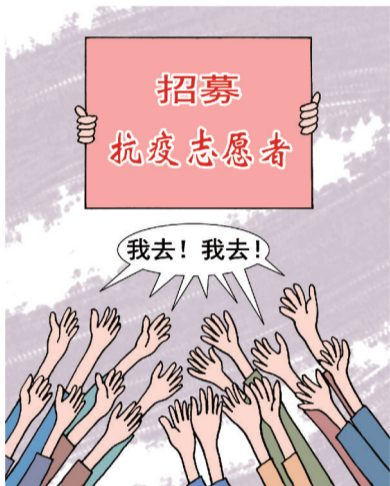
争先恐后 ■ 姚月法