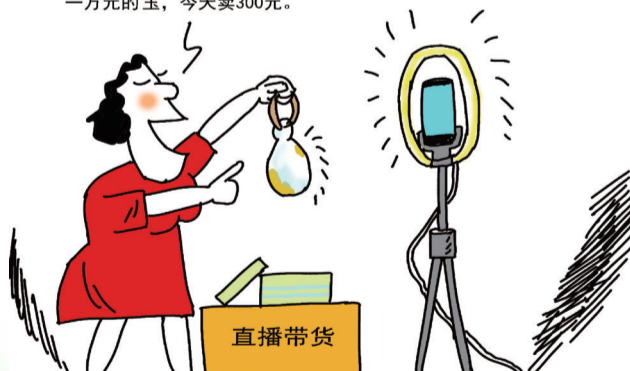
谎话连篇 ■ 罗琪