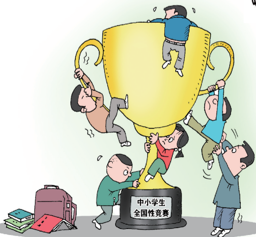
挤 ■ 沈海涛