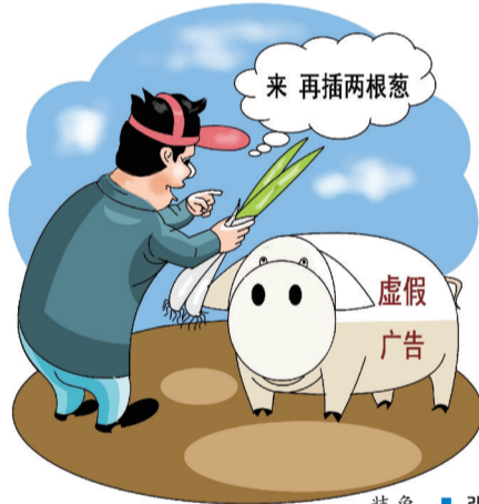
装象 ■ 张昕