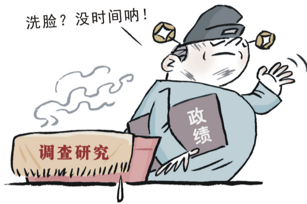
他忙得很 ■ 王永琦