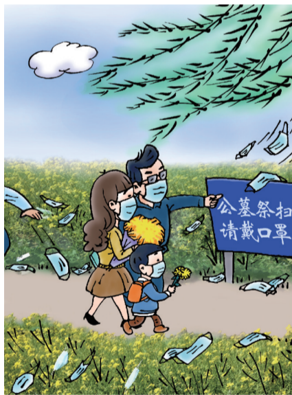
“乱花”飞舞辣人眼 ■ 朱晋