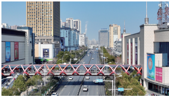
位于站前路的安徽时尚街区