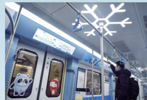
北京地铁11号线西段又被称为“冬奥支线”