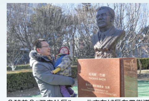
全球首个“双奥社区”——北京东城区东四街道