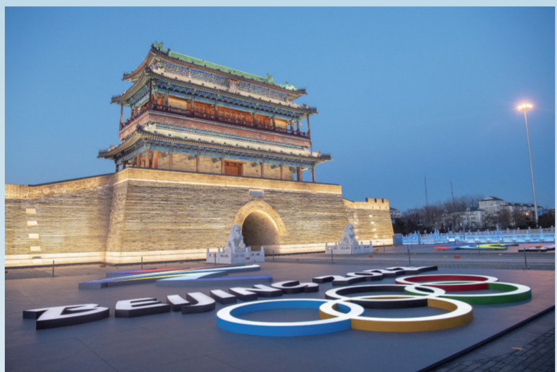
夜晚的北京中轴线南起点永定门下，巨大的冬奥主题灯饰吸引市民的目光。

北京是一座历史悠久的城市，见证了千年历史的沧桑巨变和中华文明的源远流长；北京也是一座不断展现国家发展新面貌的现代化城市，东西方文明在这里相遇交融，千年古都生机勃勃。自2015年获得冬奥会举办权以来，北京以冬奥会筹办为契机，在经济、文化、科技、教育、社会治理、生态环境等众多方面取得了举世瞩目的成就。