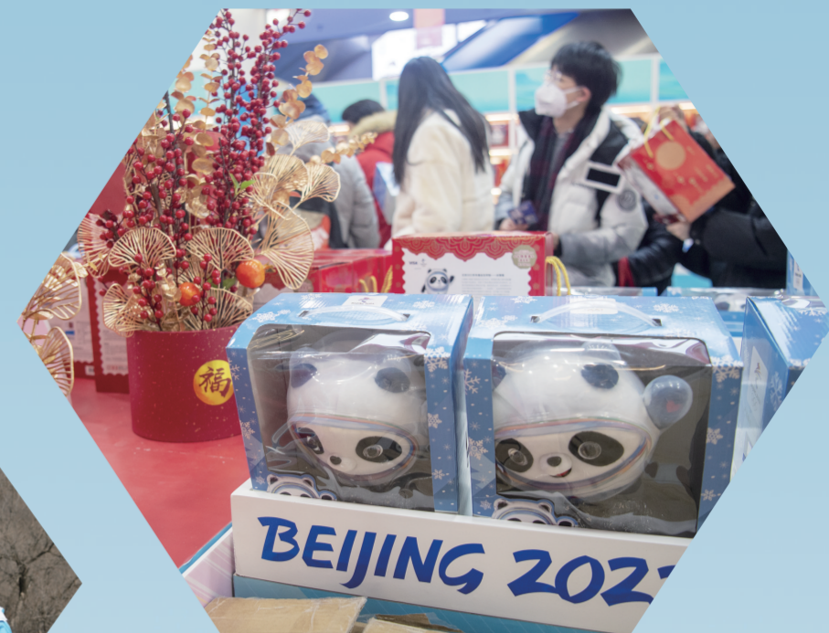
北京冬奥会顶流吉祥物“冰墩墩”引发购买热潮