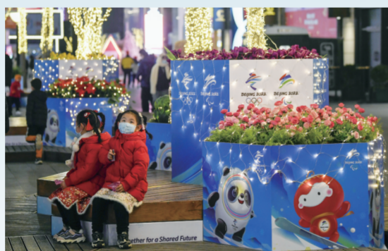
北京街头随处可见冬奥主题装饰，冬奥氛围满满。