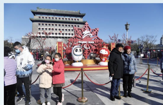
游客在北京前门大街商圈打卡冬奥元素