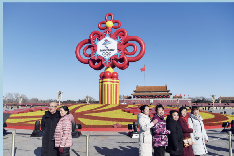
位于天安门广场中心的“精彩冬奥”主题花坛顶高17米，以中国结为主景，结合北京冬奥会会徽以及冰雪元素，传达对北京冬奥会的美好祝福。