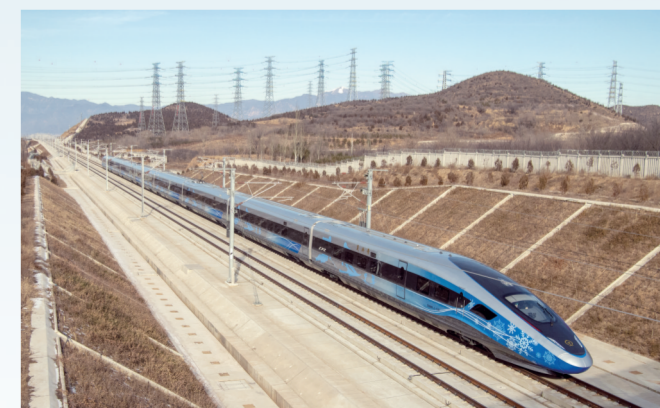
2022年2月6日，奥运版智能复兴动车组——“瑞雪迎春”号行驶过京张高铁新八达岭长城隧道出口。