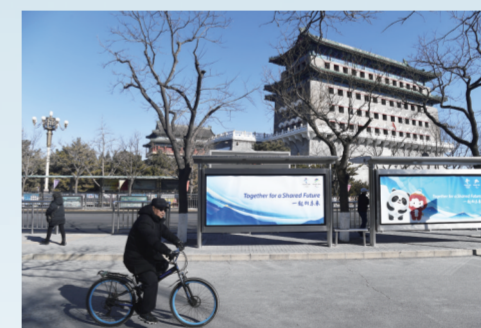
北京街头，冬奥氛围满满