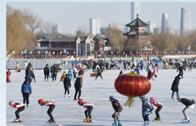
春节期间，北京市民在什刹海冰场尽享冰雪运动带来的快乐。