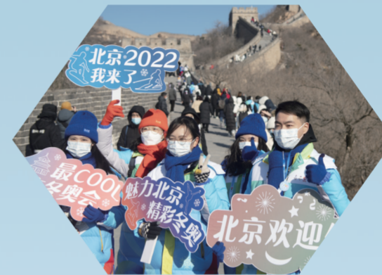
2022年2月5日，城市志愿者在北京八达岭长城为中外媒体记者采访提供服务。预计整个冬奥期间，参与城市志愿服务人次将达到20万。