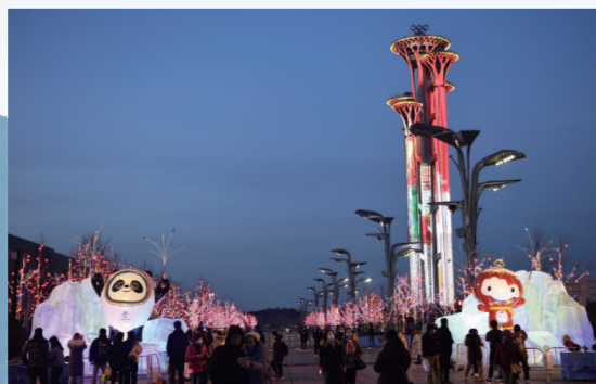
夜幕降临，位于北京奥林匹克公园冬奥会主新闻中心旁的景观亮灯，吸引了无数市民前来拍照留念。