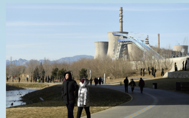
北京冬奥公园位于石景山区西部、永定河沿岸，紧邻北京冬奥组委和首钢滑雪大跳台，总面积约1142公顷。它因冬奥而生，作为北京市服务保障冬奥的重点项目之一，为2022年冬奥会和冬残奥会提供环境保障，并给北京留下宝贵的奥运遗产。