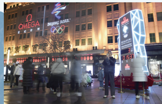
北京街头的冬奥会倒计时牌吸引市民前来拍照留念