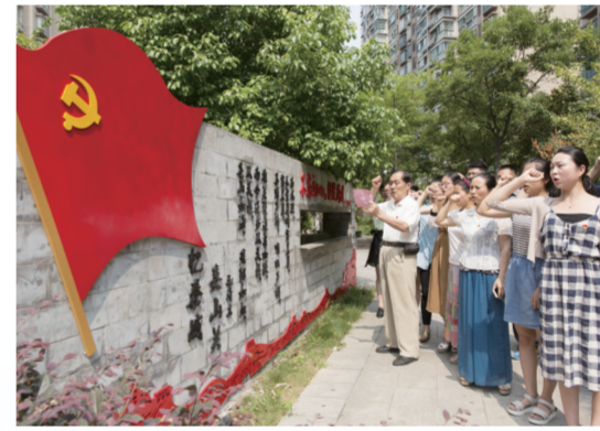
社区党员重温入党誓词，深入开展党史学习教育

同时，庐阳区将着力建成现代服务业集聚区，加快发展高端商贸服务业，完成淮河路“全国示范步行街”创建，建成银泰二期，推动长江中路商业大街打造合肥版“上海淮海路”，加快建设全省消费核心区