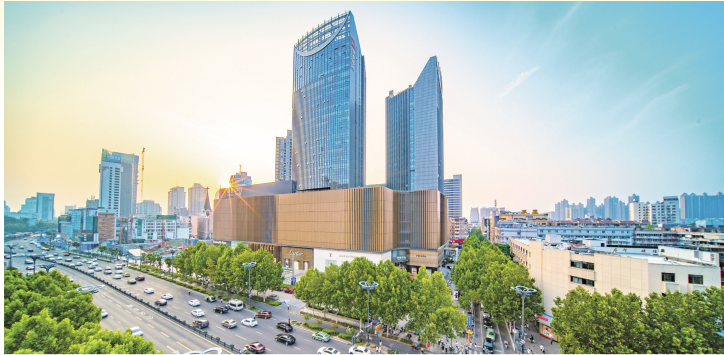
安徽省商业地标——合肥银泰中心