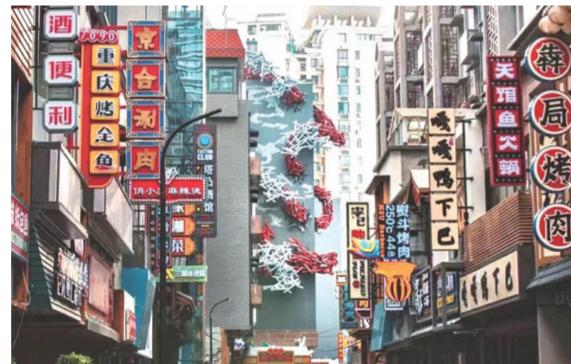
勤劳巷等背街小巷完成改造提升