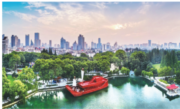
焕新归来的逍遥津公园

老城是一座城市的历史印记，也是城市的文脉和根。近年来，庐阳区深入实施老城保护更新战略，让老城区闯出新路子、焕发新活力。