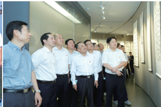
肥东县文联负责人陪同县领导观看肥东县庆祝建党百年书画展