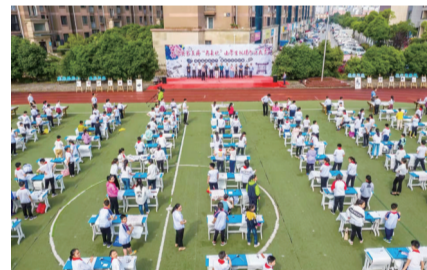
全县小学生现场书法大赛