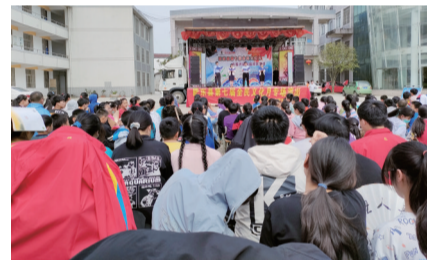
文艺志愿者参加第七届全民文化月演出