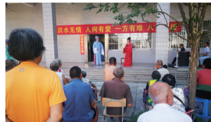
为长临河受灾安置点群众慰问演出

五是成立文艺名家工作室。 积极配合安徽省剧协、安徽省作协、安徽省书协，在长临河镇六家畝古民居群成立安徽省戏剧名家工作室、安徽省文学名家工作室、安徽省书法名家工作室，开展经常性的文艺培训和文艺志愿服务活动。