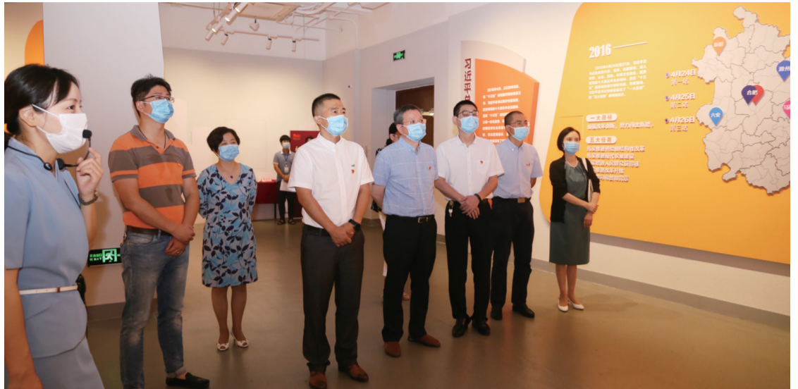
党委理论学习中心组参观“初心映江淮”主题展

先进典型作表率。大力宣扬医院“百医驻村”医生的先进事迹,组织开展“百医驻村”医生、扶贫干部返院欢迎会,邀请“安徽省最美医生”徐晓娟等分享感悟,用生动的画面、质朴的语言和一组组数据展现他们恪尽职守、甘于奉献、护佑生命、大爱无疆的精神,用鲜活感人的案例,给与会人员上了一堂意义深刻的医德医风教育课。经典诵读筑信仰。举办“诵读红色经典 传承红色精神”庆祝建党100周年红色经典诵读活动。热情讴歌党的光辉历程和丰功伟绩,充分展示医院职工昂扬的精神面貌,鼓舞人心、凝聚力量,教育引导广大党员干部职工学党史、悟思想、办实事、开新局,从党的百年伟大奋斗历程中汲取继续前进的精神力量。红色教育强引领。依托“初心映江淮”主题展,深入了解百年来中国共产党团结带领安徽人民的奋斗史和辉煌成就。充分利用红色资源,组织广大党员干部瞻仰革命历史类纪念设施、爱国主义教育基地,提高学习教育的针对性。