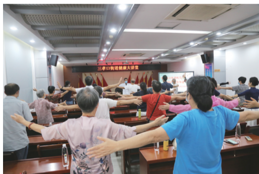
中医药宣传周讲座义诊活动