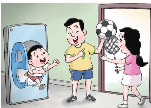
吸引 ■ 郝延鹏