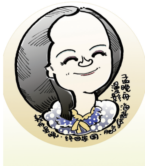
欢迎回家!孟晚舟 ■ 张海燕