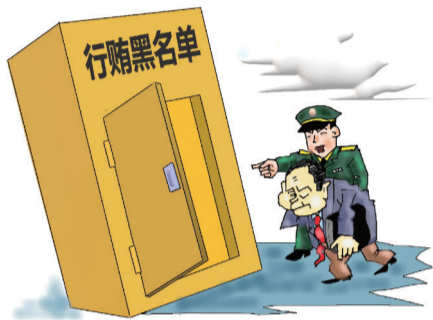
小心进了黑名单 ■ 张昕