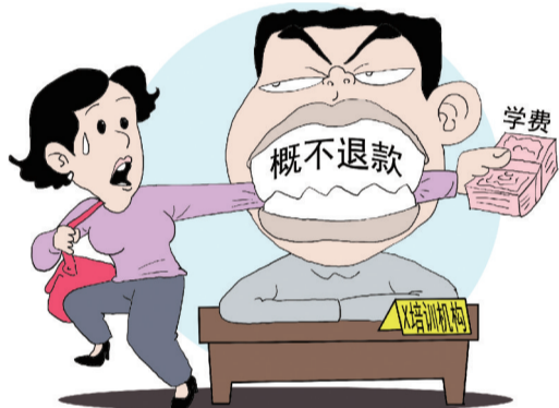
霸王条款 ■ 韦荣景