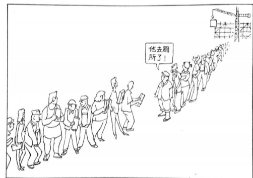
运砖 ■ 韦启美

作者简介: 韦启美(1923.9—2009.7.9),安徽安庆人。少年时代师从孙多慈学习美术。1942年入重庆中央大学艺术系,受业于徐悲鸿、黄显之、吕斯百等人。曾任中央美院油画系教研室主任,油画系研究生班主任、教授,中国美术家协会会员。1984年漫画《运砖》获第六届全国美展银牌奖。