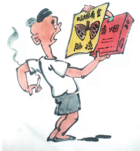
并非吓唬人 ■ 王恒/漫画