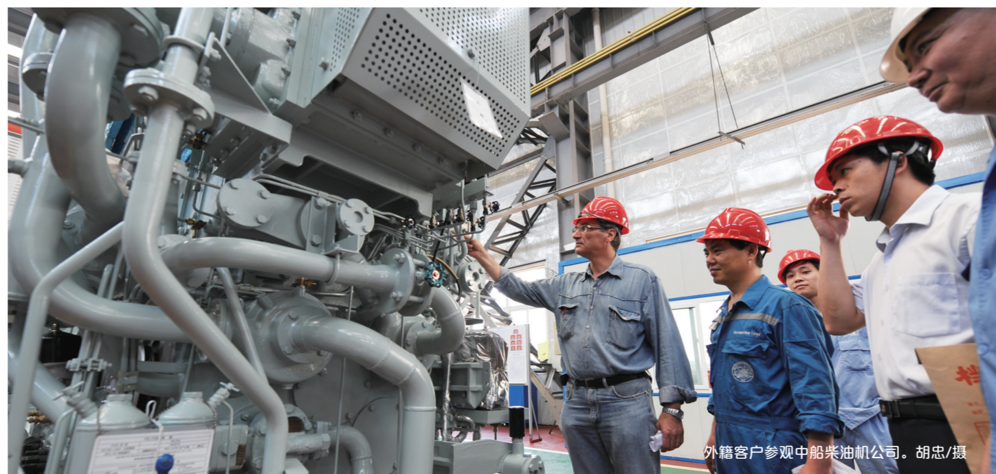
外籍客户参观中船柴机公司。