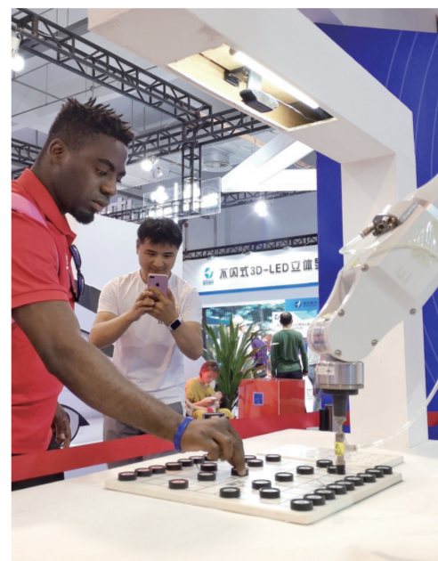
外国友人在合肥某展会上同机器人对弈。

针对“放管服”改革,黄英要求全省商务系统严格贯彻落实优化营商环境、促进公平竞争的法律法规,加快建设统一开放、竞争有序的市场体系,打造市场化、法治化、国际化营商环境,助力“双招双引”;要做好开展证照分离改革全覆盖试点、推进市场准入负面清单制度实施、深化商务领域“互联网+政务服务”各项工作。