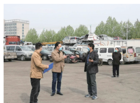
开展报废汽车安全生产检查

在培训会上,部分市、县(区)商务部门负责人就“十三五”发展成就和“十四五”规划思路接受本报记者专访。