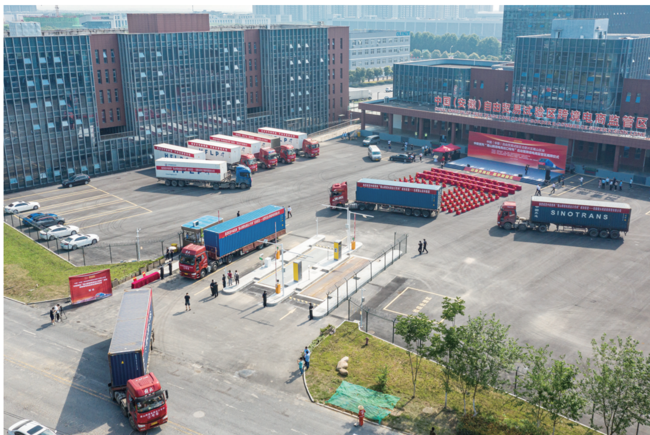
20辆蜀山跨境电商出口专列货车依次驶出跨境电商监管区