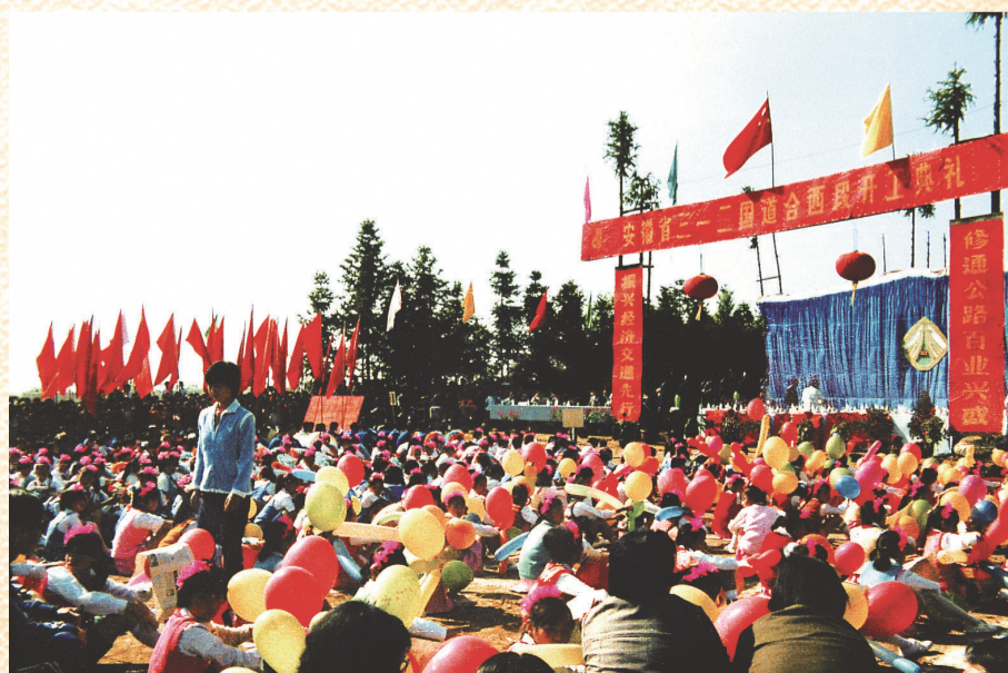
1986年,我省第一条高速公路合宁高速开工。