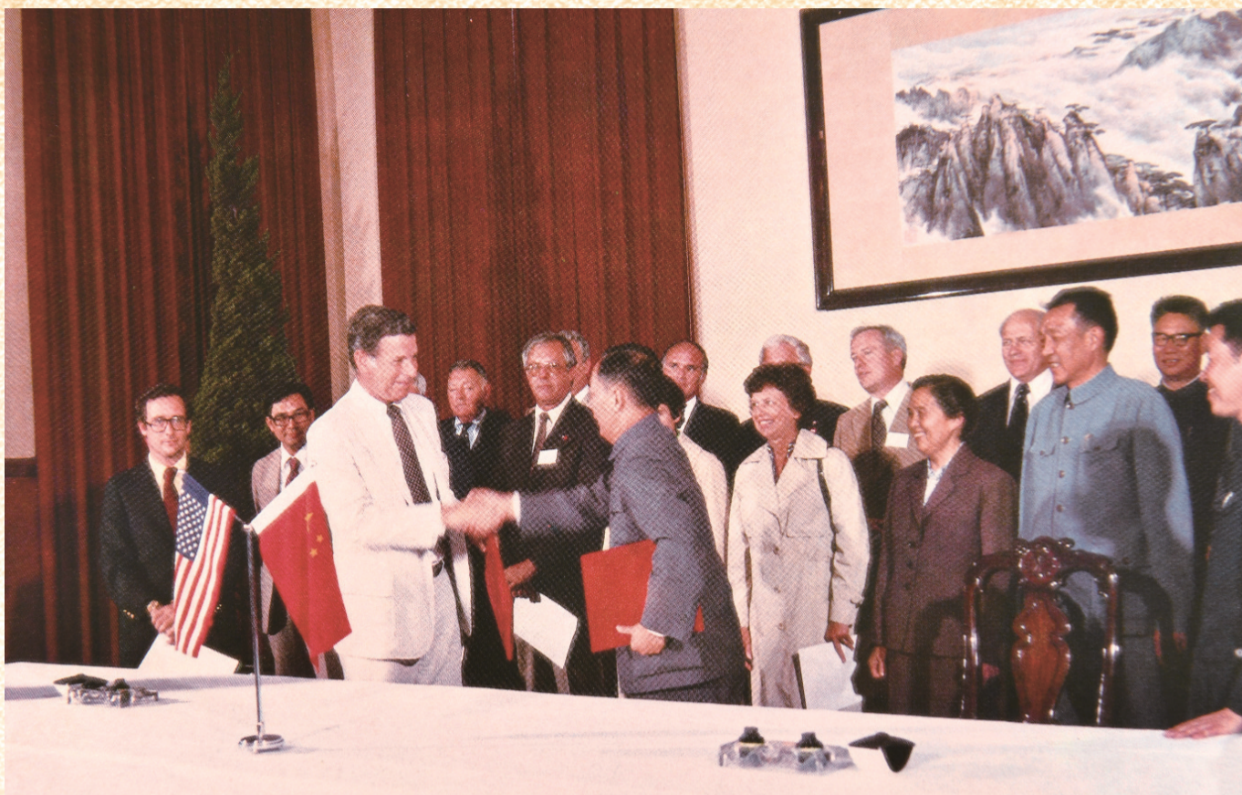
1980年6月,以休斯州长为首的美国马里兰州代表团访问安徽。这是时任安徽省委第一书记张劲夫同志和休斯州长亲切握手。