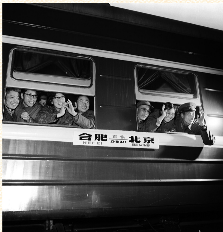
1978年4月1日,合肥至北京127/128次直快列车通车。