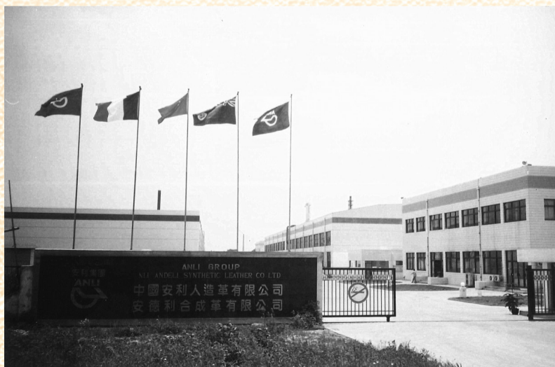
1984年,安徽省创办的第一家中外合资企业——中国安利人造革有限公司。