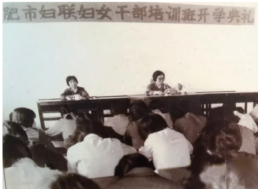
合肥市妇联妇女干部培训班开学典礼