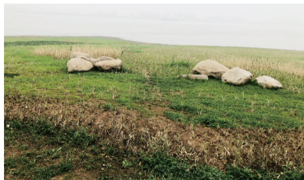
马鞍山薛家洼生态园