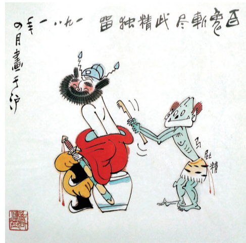
百鬼斩尽此精独留 ■ 詹同

詹同(1932-1995年),又名詹同渲,广东南海人。曾任中国动画协会副会长,中国美协漫画艺委会委员,出版漫画书籍有《詹同漫画选》《詹同儿童漫画选》和文集《我画漫画五十年》等。1994年,詹同先生被中国美术家协会漫画艺术委员会授予“中国漫画金猴奖”荣誉奖。