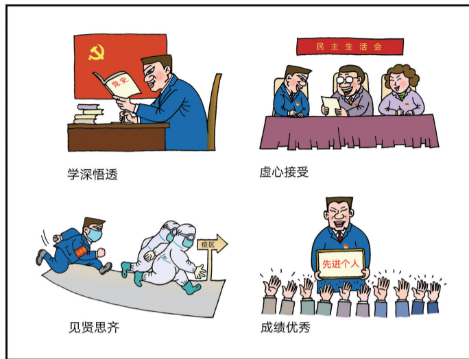
学党史见行动 ■ 王真(黑龙江)