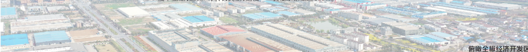
俯瞰全椒经济开发区

今年以来,企业服务中心在全椒县开展惠企稳岗政策宣传和措施落实,加大“四送一服”企业走访力度,了解企业春节期间生产经营、疫情防控措施安排、外来务工人员生产用工等方面的难题。春节前,全椒县45家包保单位共走访178家重点企业,收集和办理企业诉求用工、用地、资金等方面问题建议28个,统计留外地员工1400多人。根据走访上报企业情况,海螺水泥等4家企业春节不停工,2月底前全县复工企业达100%。