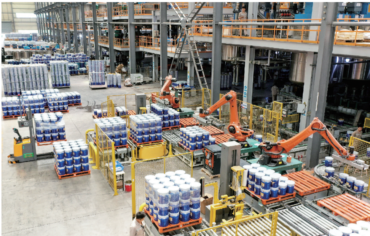
全椒亚士创能科技公司智能化生产仓储车间

“全椒速度”“全椒效率”“全椒服务”营造了“全舒心”的营商环境,助力企业快速发展,2020年南大光电已实现全面量产,主要产品高纯磷烷、砷烷在这之前还荣登国家十二五科技创新成就展。同时,南大光电在全椒进一步加大投放,第二个项目全椒南大光电半导体有限公司新厂区已全面建成,进入试生产。全椒良好的营商环境和南大光电的示范作用,在这一片热土迅速集聚了多家电子新材料企业相继入驻、开工和投产。七年前的一片荒岗如今已经成为中国电子新材料产业发展的一片高地。