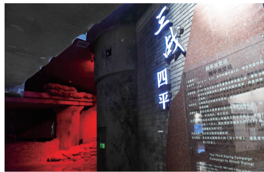
四平战役纪念馆内景。

吉林小城四平,在沈阳、长春之间,京哈铁路沿线上,它是连接东西南北铁路和公路的交通枢纽。