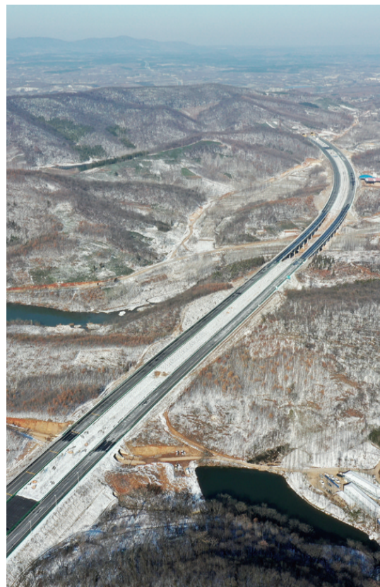
沪陕高速公路滁州支线。