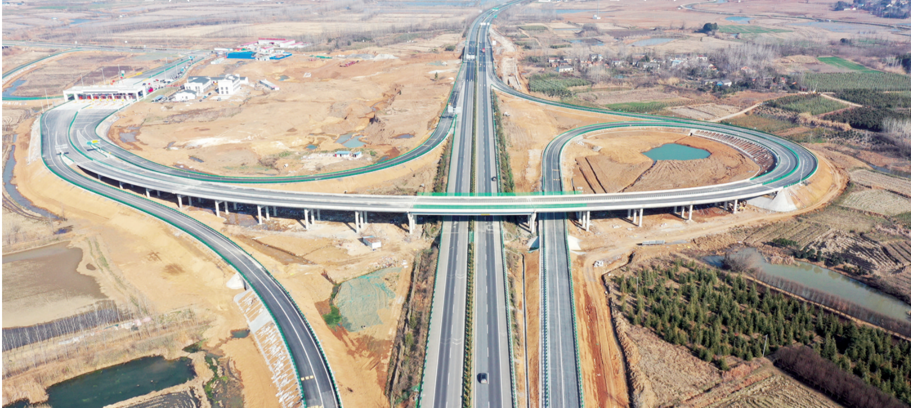
2月9日,北沿江高速滁(滁州)马(马鞍山)段全椒东互通建成通车。