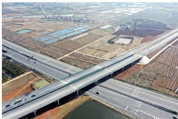
全椒县新昌大道二标段(上)和合宁高速全椒段(下)。