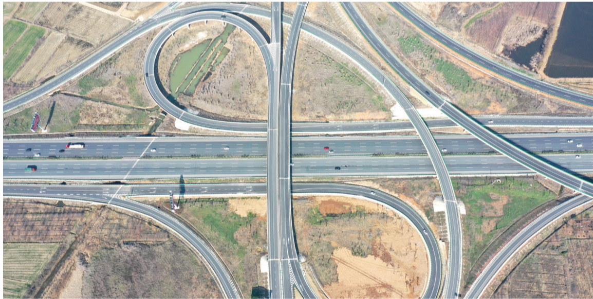
沪陕高速全椒西枢纽。 ■ 新华社发 沈果/摄

在长三角一体化发展的大背景下,安徽省全椒县在交通建设方面注重“内通外联”,去年以来实施新建和改造项目35项。同时在基础设施、体制机制、公共服务等领域与江苏南京等地加强合作交流,将蓝图变通途,推进长三角区域一体化发展项目的落地开花。 ■ 沈果