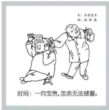
时间：一向宝贵，怎奈无法储蓄。