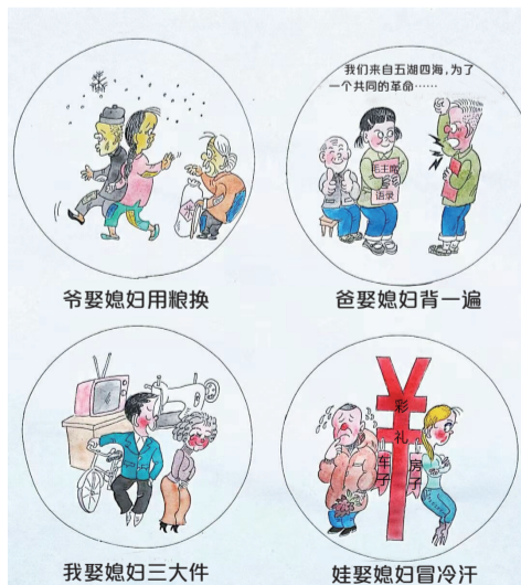
祖孙四代娶妻记 ■张运河

小启：本版部分文章转载于其他期刊及网络，刊发时无法及时与原作者取得联系，烦请原作者联系我们，以便支付稿酬。联系邮箱：xbmh2020@126.com