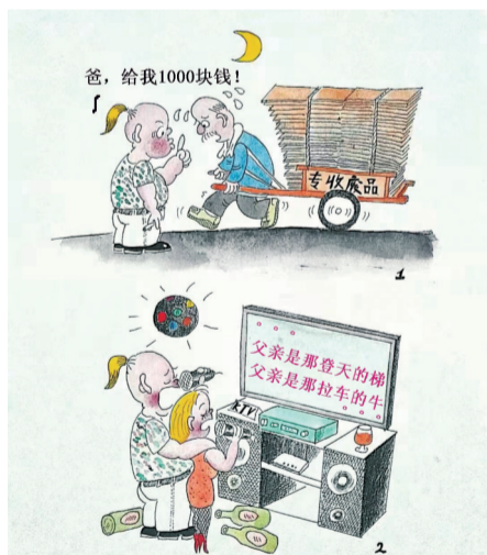
赞美的代价 ■ 张运河(山东)