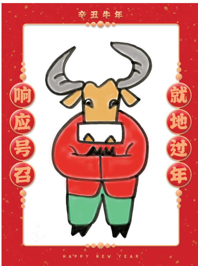
就地过年 ■ 冯火(河北)