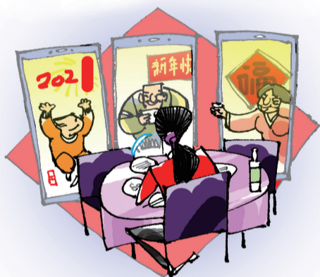
难忘的“新年” ■ 马菁海(吉林)