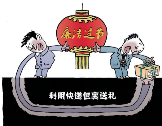
暗度陈仓 ■ 蒋跃新(新疆)