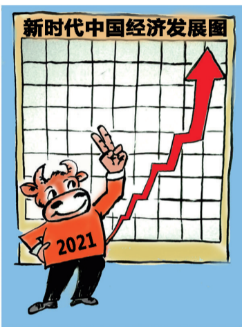
牛气冲天 ■ 郭继宗(河北)