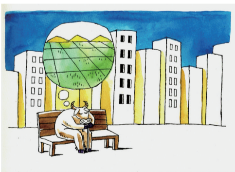
田野 ■ 罗琪(江西)