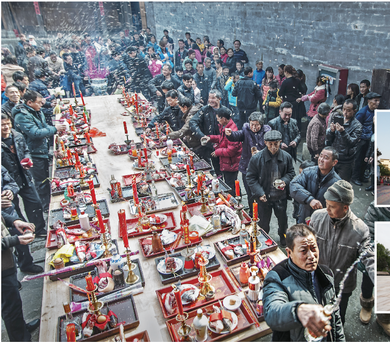
闪里镇磻村乡村祭祀