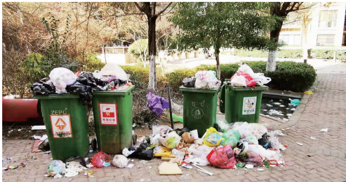
垃圾桶内堆满垃圾无人清理