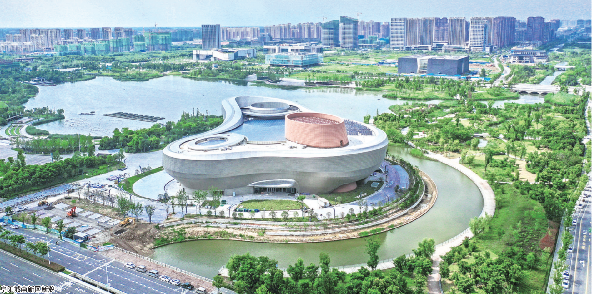
阜阳城南新区新貌

顺利签订战略合作协议，推动双方在产业协调发展及科技创新、绿色农产品、人才交流等领域的合作，各县市区与长三角中心区县市的战略合作也在持续推进中。举办“融入长三角·高铁全覆盖”阜阳市情推介暨招商恳谈会，集中签约项目108个、总投资1005亿元，面向长三角地区签约项目47个，其中产业类项目29个、总投资442.75亿元。设立6家阜阳市驻长三角招商中心，对接长三角招商项目100多个，其中签约项目46个，投资额102.6亿元。面对新的历史机遇，阜阳市将以承接转移为契机，成立专业机构瞄准沪苏浙等产业发达、资本密集的区域，针对高新技术企业、现代服务业和装备制造、电子信息、纺织服装等产业转移项目开展招商项目对接，以共同发展为目标，推动园区合作。如今，阜阳被评为中国中部最佳投资城市和苏商、浙商投资中国首选城市，汇集了高质量发展新动能。