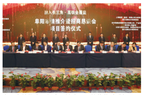
阜阳市情推介暨招商恳谈会项目签约仪式现场

2019年10月15日，在长三角城市经济协调会第19次会议上，阜阳被吸纳为新成员，正式“入圈”长三角。去年年底，阜阳同时开通商合杭、郑阜两条高铁，实现市域全覆盖。一个更美丽更强大、一个更高质量发展的阜阳，展现在全国人民面前。更好的营商环境，吸引了大批外商的扎根，今年前三季度，全市实际利用外资2.94亿美元，同比增长5.1%，新设立外资企业10家，同比增长100%。此外，今年11月10日，中央文明办公布第六届全国文明城市入选城市名单和复查确认保留荣誉称号的前五届全国文明城市名单，阜阳市正式入选全国文明城市。 ■ 记者 杨文艺 宋才华