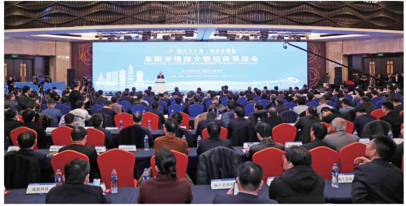
“融入长三角·高铁全覆盖，阜阳市情推介暨招商恳谈会”现场