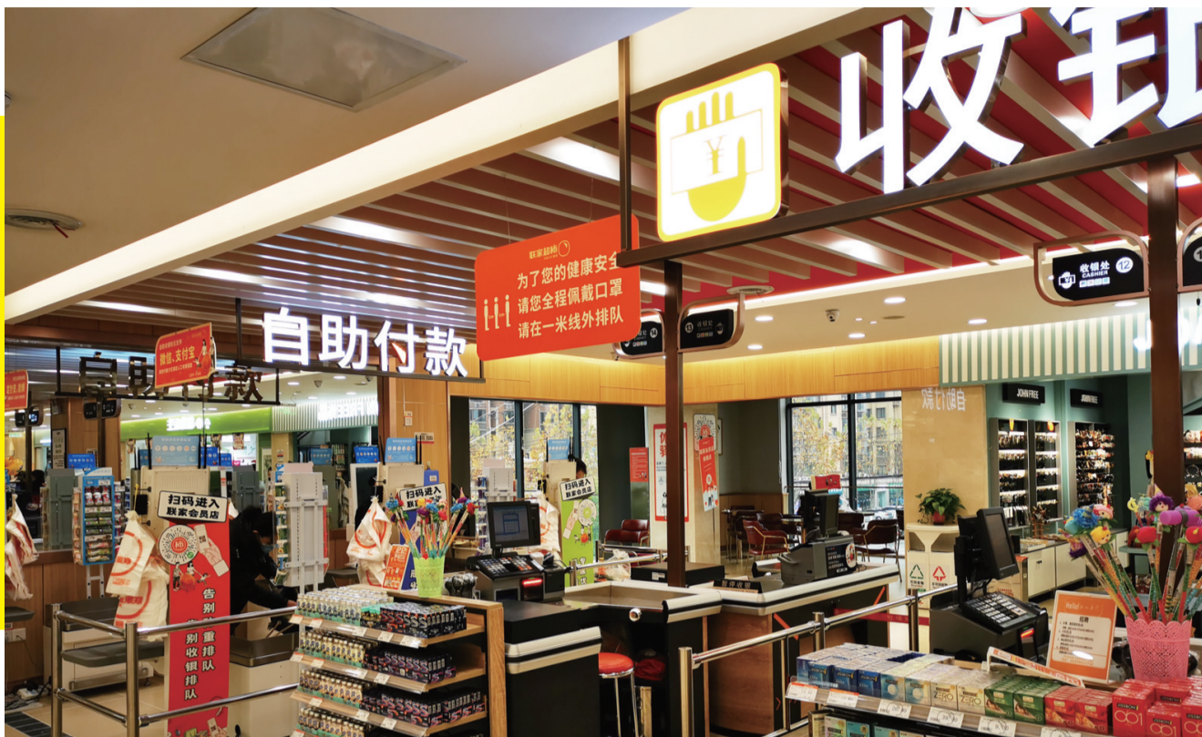
蜀峰路某大型商超内设有自助收银区和人工收银区