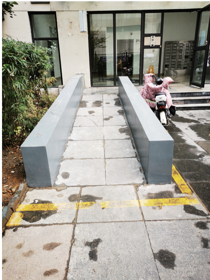
新建的无障碍通道