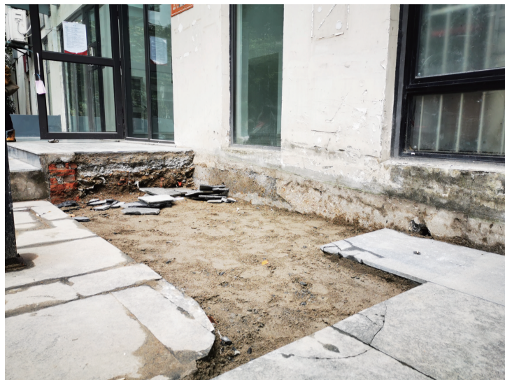
旧无障碍通道现状