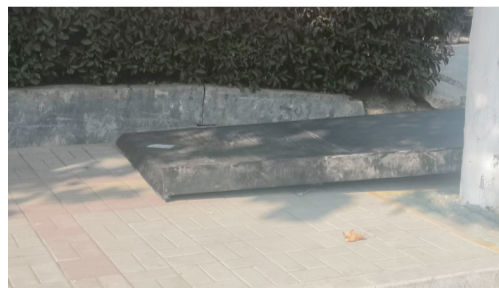
广德路附近，盲道上放置了一个铁块，无人管理，也没有任何提示