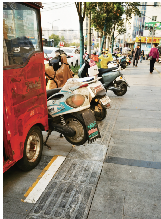
科学岛路附近的盲道上停满电动车