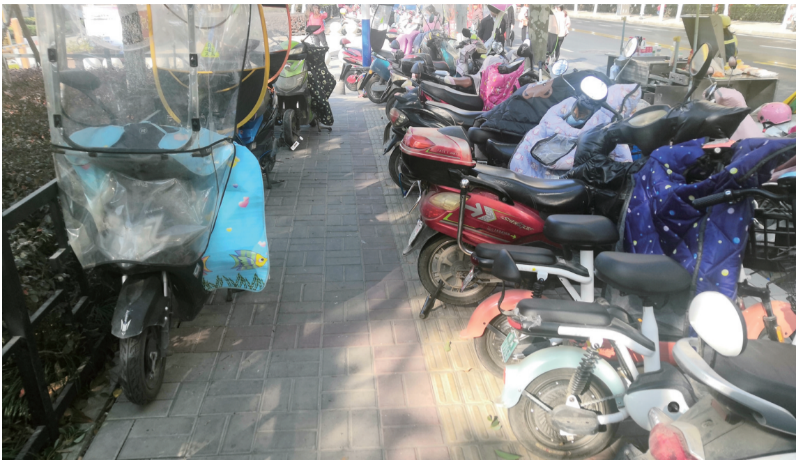
长临路的盲道上停满了电动车