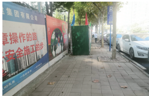
长临路附近，一块铁制隔板将盲道隔开