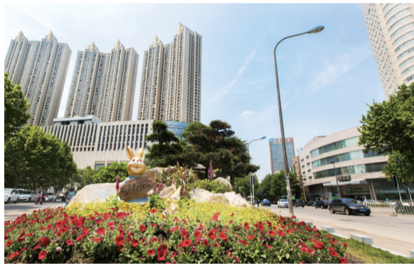
改造后的明光路点缀着街头花境