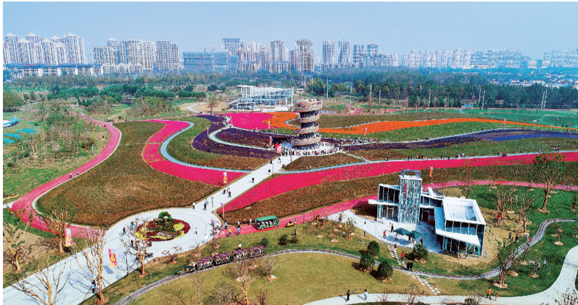
本月，安徽首个以青年为主题的创意田园在瑶海区开园

“合肥东部新中心建设受到广泛关注，诸多央企和知名企业前来联系洽谈，表达投资意愿，探寻合作路径。”相关人士表示，正在大力推进招商工作，积极推动片区整体开发。目前，长三角G60科创走廊物联网产业合作示范园、猪八戒网安徽总部等企业已经落户东部新中心；东部新中心还与中国宝武、华润置地等企业集团签订了合作框架协议，中国金茂、上海复星、龙湖集团等大型企业也高度关注片区的开发。“我们将结合片区开发和土壤污染治理修复进程，加快推动项目落地。”相关负责人表示。