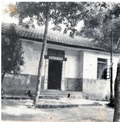
南陵县政府为李家发家人修建的烈士之家

正在紧急关头，敌人暗堡的机枪声突然静了下来。原来，昏迷的李家发不知什么时候醒了过来，以惊人的毅力悄悄爬近敌人暗堡，用自己的胸膛挡住了暗堡的机枪射孔。为掩护部队冲锋，取得战斗胜利，李家发献出了年仅19岁的生命。