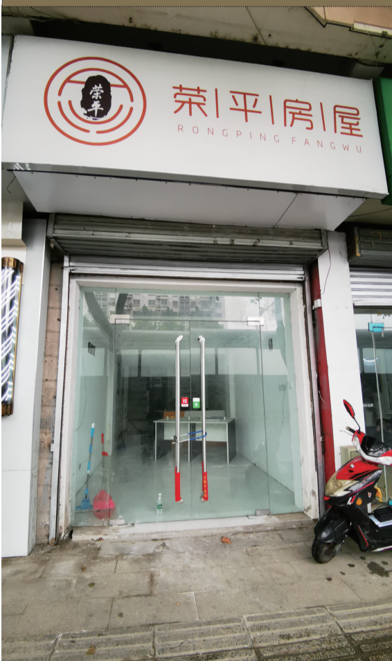
荣平房屋注册地去楼空