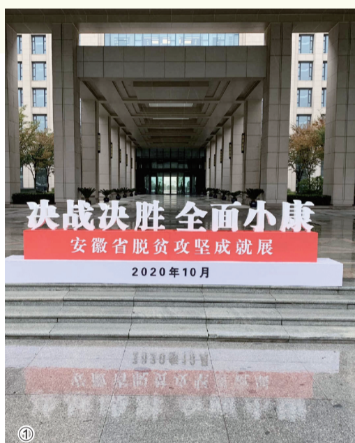
①②成就展在省行政中心1号楼展出(组图)