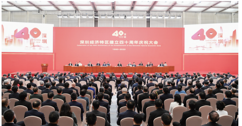
深圳经济特区建立40周年庆祝大会隆重举行。

新华社深圳10月14日电 深圳经济特区建立40周年庆祝大会14日上午在广东省深圳市隆重举行。中共中央总书记、国家主席、中央军委主席习近平在会上发表重要讲话强调,要高举中国特色社会主义伟大旗帜,统筹推进“五位一体”总体布局,协调推进“四个全面”战略布局,从我国进入新发展阶段大局出发,落实新发展理念,紧扣推动高质量发展、构建新发展格局,以一往无前的奋斗姿态、风雨无阻的精神状态,改革不停顿,开放不止步,在更高起点上推进改革开放,推动经济特区工作开创新局面,为全面建设社会主义现代化国家、实现第二个百年奋斗目标作出新的更大的贡献。