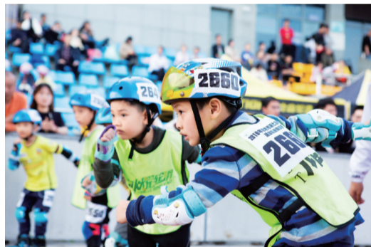
合肥有丰富多样的运动场馆供市民运动