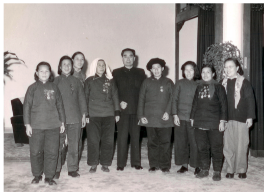
1959年12月18日，时任全国妇联第三届书记处书记吴靖（右一）与周恩来总理在一起的合影