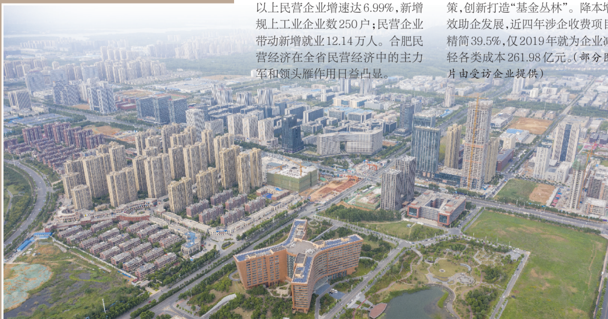
合肥高新区聚集众多高新技术企业