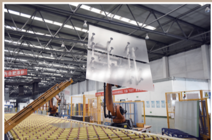
彩虹光伏为全球最大的全氧燃烧光伏玻璃生产基地