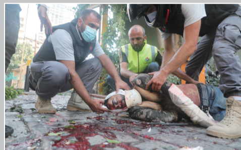
人们救治一名爆炸中的伤者