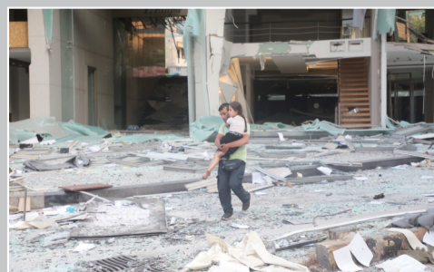
一男子抱着孩子走过严重受损的建筑