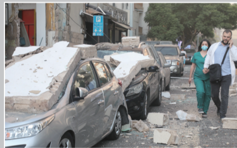
人们从爆炸中受损的车辆旁走过

黎总理迪亚卜当天视察爆炸现场,随后宣布5日为全国哀悼日,并表示黎巴嫩将向国际社会寻求帮助。