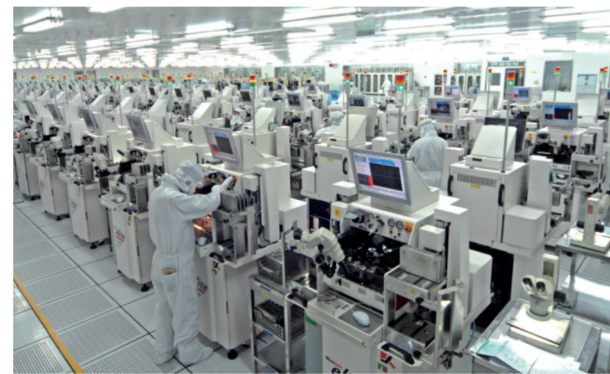
滁州经开区长电科技有限公司生产车间

组织立起来,摸排55家新建非公企业党员队伍情况,组建党组织10家(其中单独组建8家),调整优化17个联合党支部。此外,围绕滁州市创新发展“一号工程”,在项目建设期间指导惠科光电成立党支部,做到与新建项目同步推进。