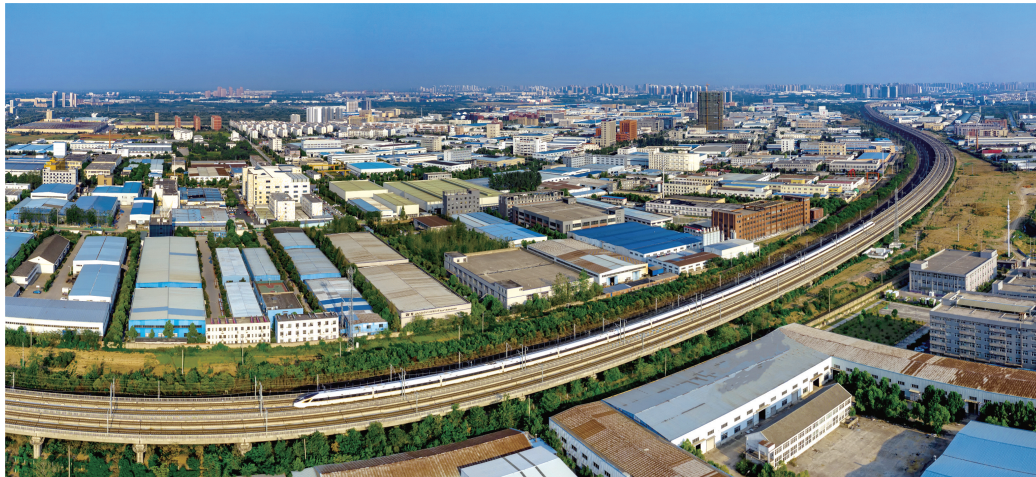
腾飞的长丰(双凤)经开区