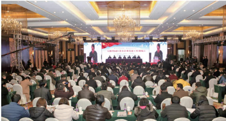
2018年安徽省园区非公企业党建工作现场会在当涂经开区召开

开发区是经济发展的强大引擎、对外开放的重要载体、体制改革的试验基地。如何通过非公党建为抓手助推园区发展呢?