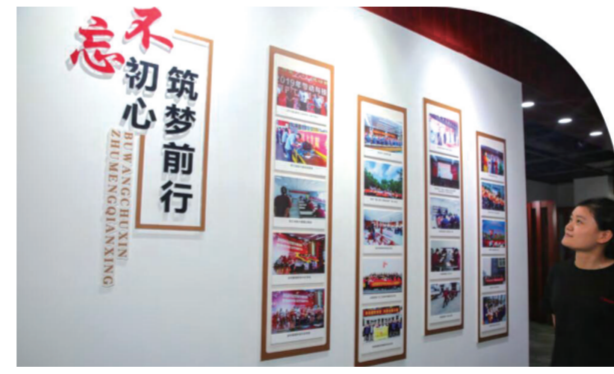
肥西经开区益企党群服务中心内,“不忘初心 筑梦前行”照片墙

量资源,成立“益企”党建服务工作领导小组,为非公企业排忧解难。建生物医药、智能制造和小微企业等产业党建联盟,打造产业共同体、利益共同体和党建共同体。依托“益企”党群服务中心,整合党务服务、公共服务、产业服务和社会服务四大类服务资源,建立“服务企业资源包”,实行“打包式”服务,套餐化定制,项目化配送。